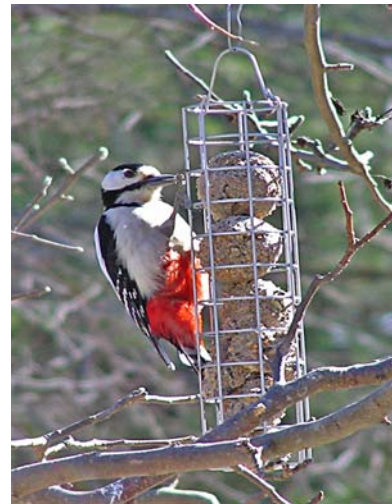
Större hackspett hackar fett.

Börjar dock med att berätta om en vanlig lägenhet på Södermalm bebodd av en av våra söner med familj. Kanske av intresse för dem som bor likartat. Det är ju normalt förbjudet att mata fåglar på balkongen, men en av deras grannar upptäcktes dragandes en gren från ett närbeläget träd till balkongräcket med en båtshake och sedan hänga upp både talgbollar och fröbehållare.