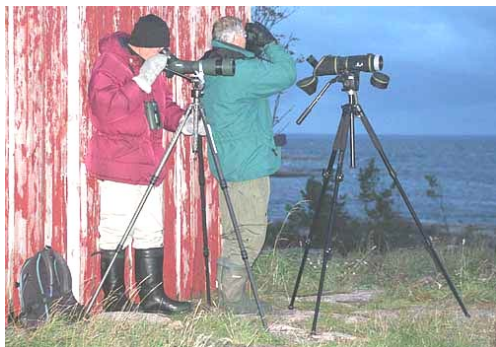
Gryningsspaning över blåsigtt hav.