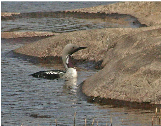
En av storlommarna i Drängsjön.

Hör av dig till Kjell Eriksson om du vill boka en fågelatlasruta i ovannämnda marker. En mer detaljerad beskrivning över hur själva inventerandet går till finns att läsa i Fåglar i Stockholmstrakten nr 1 2007 .