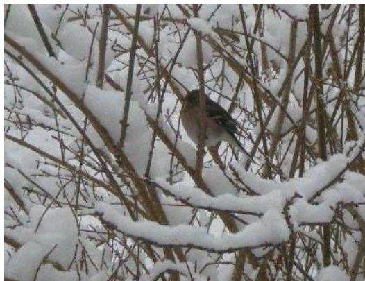
Vinterfågel på Prästgårdsvägen. RED